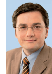
Thomas Kutschaty Mdl Stv. rechtspolitischer Sprecher der SPD-Landtagsfraktion NRW