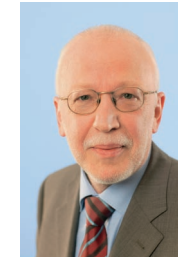
Wolfram Kuschke Mdl Sprecher der SPD-Landtagsfraktion im Hauptausschuss