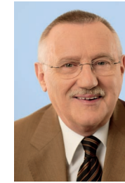
Edgar Moron Mdl 1. Vizepräsident des Landtags NRW